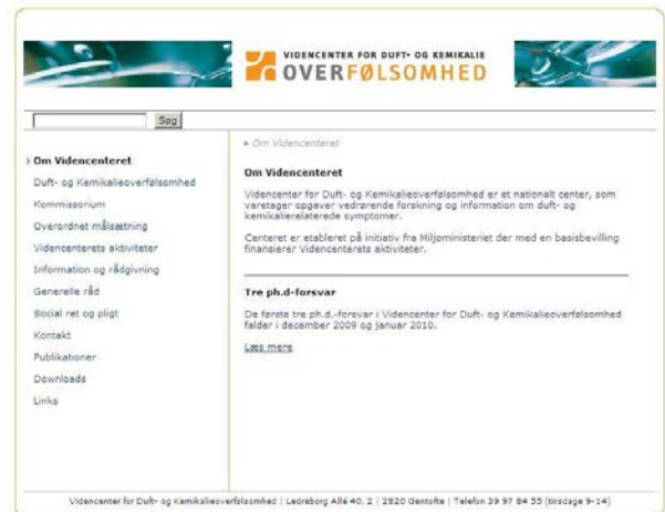
Videncentrets hjemmeside fra 2006-2009