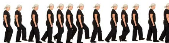
"Mindful walking" – en af mindfulnessøvelserne.

Metoden er relativ ny inden for den tradition, der hedder kognitiv terapi og har været afprøvet videnskabeligt på en række forskellige tilstande som f.eks. depression, kroniske smerter og kræft.